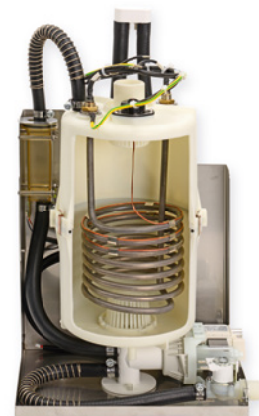
SteamKit H06 mit kapazitivem Wasserstandssensor