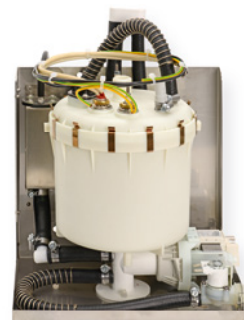
SteamKit H02 mit Schwimmerschalter